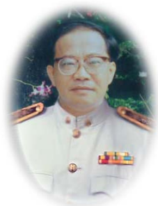
คณะกรรมการ