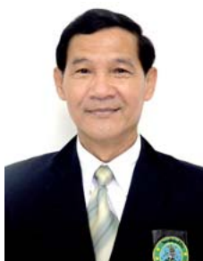
คณะกรรมการ วิทยาลัยลุ่มน้ำปิง

E-mail : vsuthawan@yahoo.com / veerapongs@hotmail.com