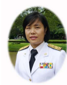
คณะกรรมการ