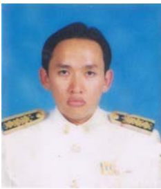
คณะกรรมการ