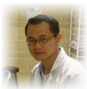
คณะทำงาน มหาวิทยาลัยราชภัฏพิบูลสงคราม