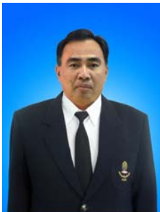
คณะกรรมการ