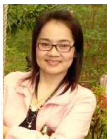
คณะกรรมการ วิทยาลัยพิษณุโลก