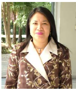
คณะกรรมการ