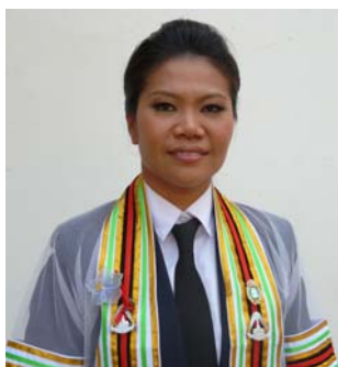
คณะกรรมการ วิทยาลัยชุมชนอุทัยธานี