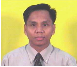
คณะกรรมการ