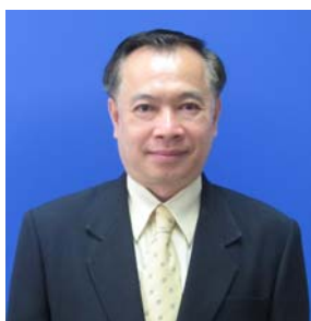
คณะกรรมการ วิทยาลัยพิษณุโลก