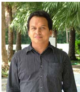
คณะกรรมการ