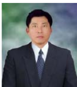
คณะกรรมการ